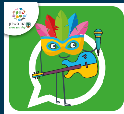
עדכוני תרבות ואירועים