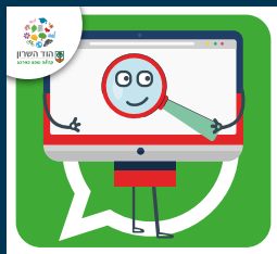
עדכוני דרושות.ים בעיריית הוד השרון