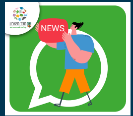
English Speakers Hod Hasharon