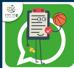
עדכוני בריאות, ספורט, קיימות ואיכות סביבה