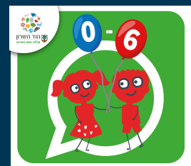
עדכוני הגיל הרך (0-6)