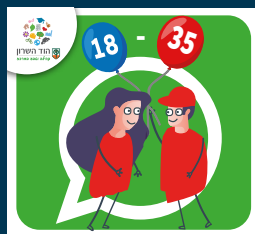
עדכוני צעירות וצעירים (18-35)