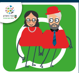
עדכוני ותיקות וותיקים +60