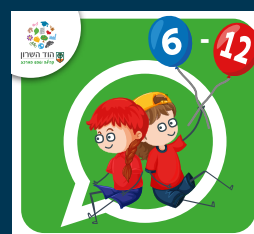
עדכוני ילדות וילדים (6-12)