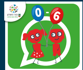
עדכוני הגיל הרך (0-6)