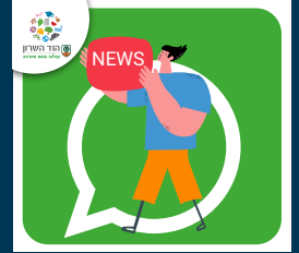
English Speakers Hod Hasharon