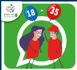
עדכוני צעירות וצעירים (18-35)