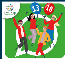
עדכוני נוער (13-18)