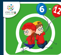
עדכוני ילדות וילדים (6-12)