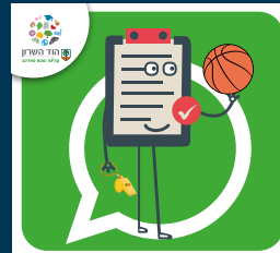
עדכוני בריאות, ספורט, קיימות ואיכות סביבה