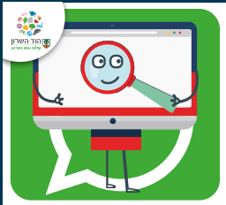
עדכוני דרושותים בעיריית הוד השרון