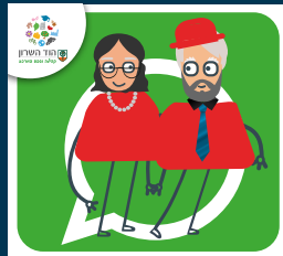
עדכוני ותיקות וותיקים +60