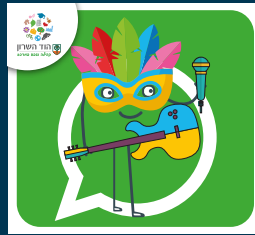
עדכוני תרבות ואירועים