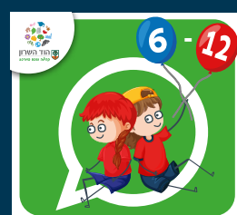
עדכוני ילדות וילדים (6-12)