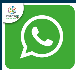
עדכונים ישירים מהעירייה בוואטסאפ בכל התחומים