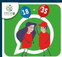
עדכוני צעירות וצעירים (18-35)