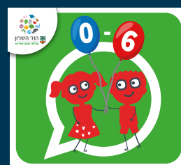
עדכוני הגיל הרך (0-6)