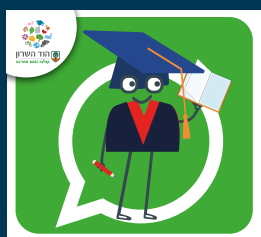
עדכוני מערכת החינוך