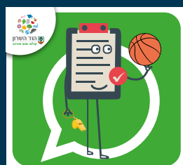
עדכוני בריאות, ספורט, קיימות ואיכות סביבה