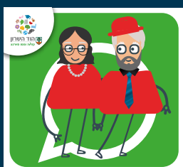
עדכוני ותיקות וותיקים +60