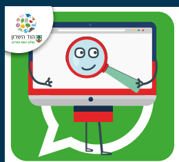
עדכוני דרושות. בעיריית הוד השרון