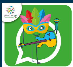
עדכוני תרבות ואירועים