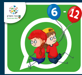
עדכוני ילדות וילדים (6-12)