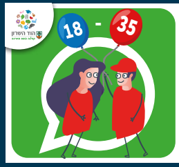
עדכוני צעירות וצעירים (18-35)