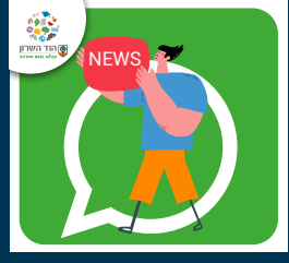
English Speakers Hod Hasharon