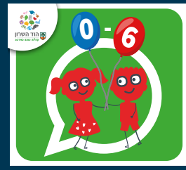
עדכוני הגיל הרך (0-6)