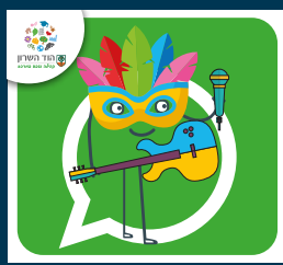
עדכוני תרבות ואירועים