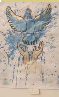
מאיה אלקס - תעודת הערכה