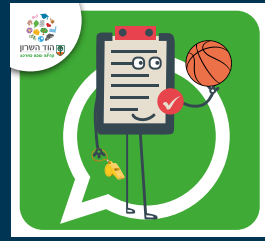
עדכוני בריאות, ספורט, קיימות ואיכות סביבה