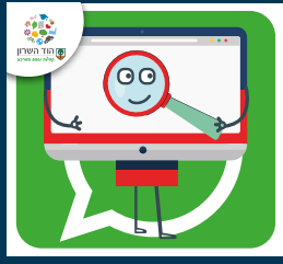
עדכוני דרושותים בעיריית הוד השרון