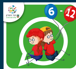
עדכוני ילדות וילדים (6-12)