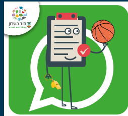
עדכוני בריאות, ספורט, קיימות ואיכות סביבה