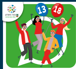
עדכוני נוער (13-18)