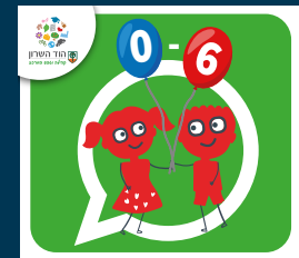
עדכוני הגיל הרך (0-6)