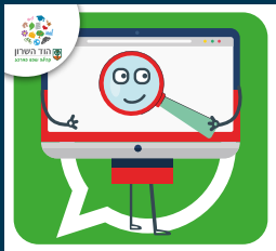
עדכוני דרושות. בעיריית הוד השרון