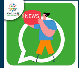
English Speakers Hod Hasharon