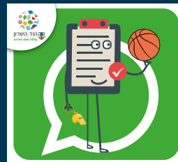
עדכוני בריאות, ספורט, קיימות ואיכות סביבה