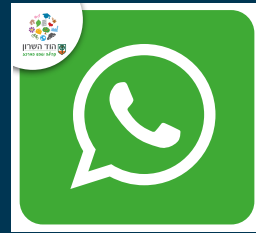
עדכונים ישירים מהעירייה בוואטסאפ בכל התחומים