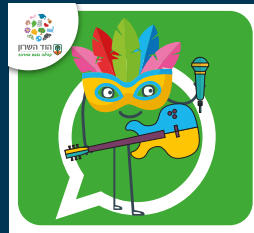
עדכוני תרבות ואירועים