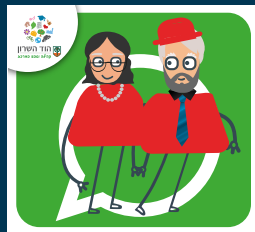
עדכוני ותיקות וותיקים +60