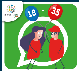
עדכוני צעירות וצעירים (18-35)