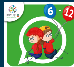
עדכוני ילדות וילדים (6-12)