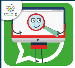
עדכוני דרושות.ים בעיריית הוד השרון