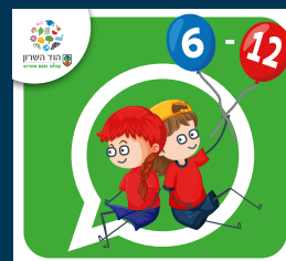
עדכוני ילדות וילדים (6-12)