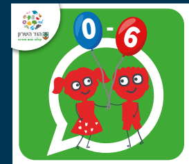
עדכוני הגיל הרך (0-6)