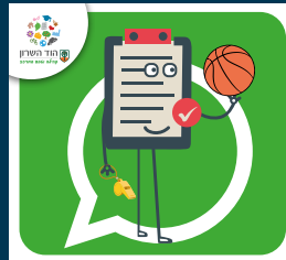
עדכוני בריאות, ספורט, קיימות ואיכות סביבה