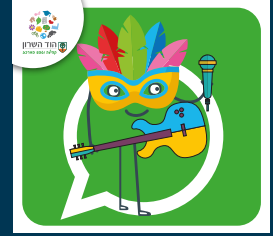
עדכוני תרבות ואירועים