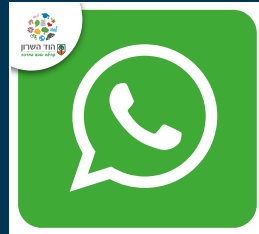
עדכונים ישירים מהעיירה בוואטסאפ בכל התחומים