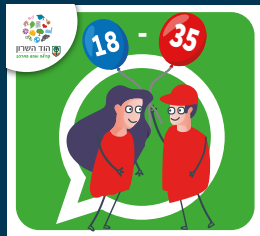
עדכוני צעירות וצעירים (18-35)