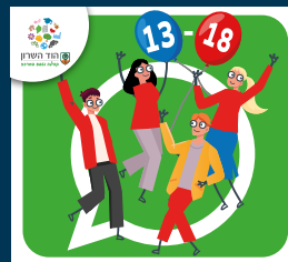
עדכוני נוער (13-18)