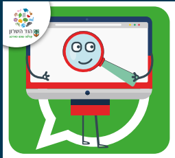
עדכוני דרושות. בעיריית הוד השרון