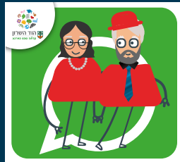
עדכוני ותיקות וותיקים +60