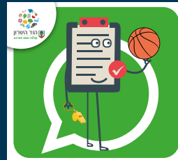
עדכוני בריאות, ספורט, קיימות ואיכות סביבה