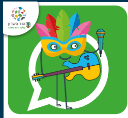
עדכוני תרבות ואירועים