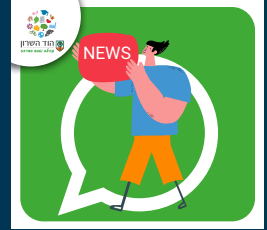
English Speakers Hod Hasharon