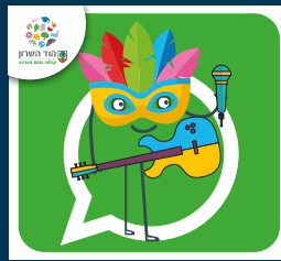
עדכוני תרבות ואירועים