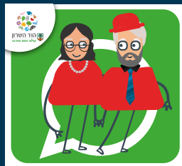
עדכוני ותיקות וותיקים +60