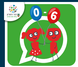
עדכוני הגיל הרך (0-6)