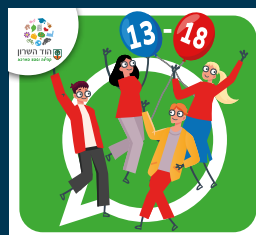
עדכוני נוער (13-18)