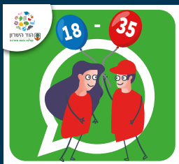
עדכוני צעירות וצעירים (18-35)