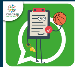
עדכוני בריאות, ספורט, קיימות ואיכות סביבה