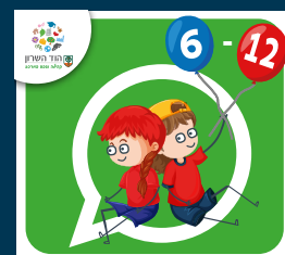
עדכוני ילדות וילדים (6-12)