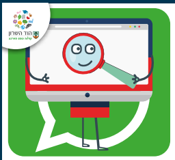
עדכוני דרושותים בעיריית הוד השרון