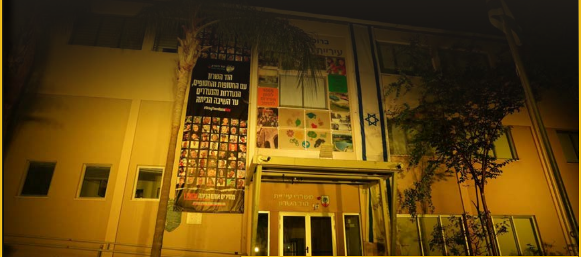
300 ימים ויליות לשבעה באוקטובר, בניין העירייה הואר בצהוב