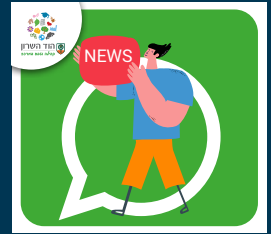
English Speakers Hod Hasharon