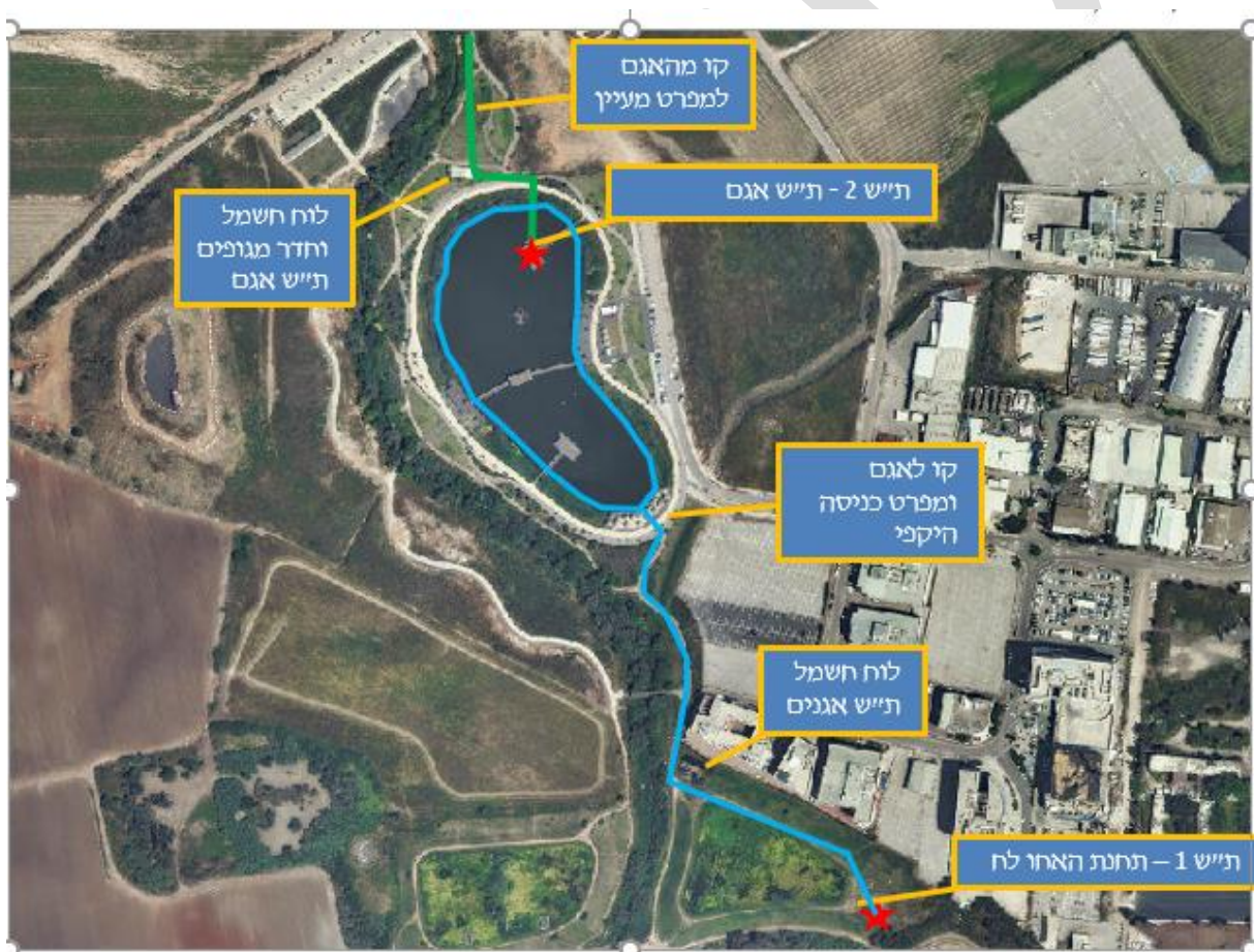
איור 1 – תנוחה כללית ומיקומי תחנות שאיבה